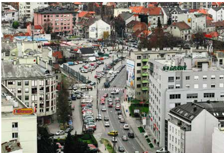
ELVIR TABAKOVIĆ/HANZA MEDIA

izvoditi u suradnji sa strukom i Gradom.