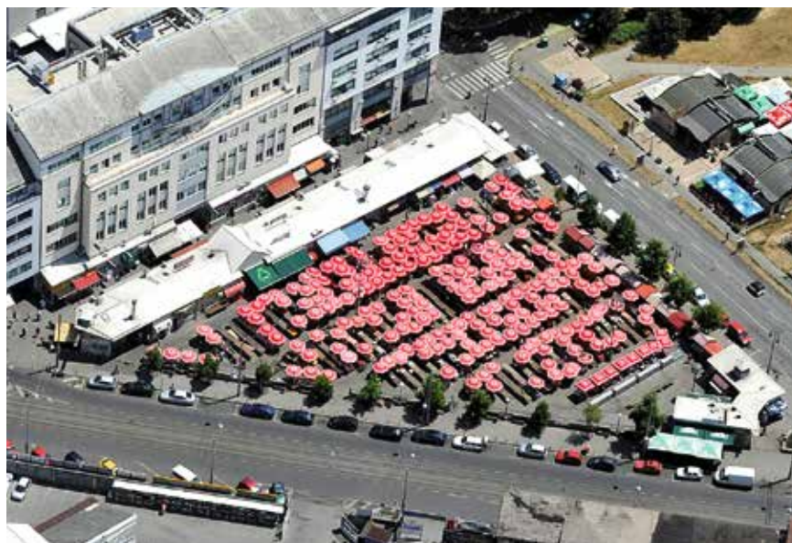
SREDAN VRANČIĆ/HANZA MEDIA

– Osnovna ideja mog programa je nastaviti tamo gdje smo stali i postignute rezultate koji se vrlo lako mogu provjeriti podvostručiti, a sve u svrhu poboljšanja kvalitete življenja naših sugrađana najljepše četvrti u gradu – zaključio je Stura.