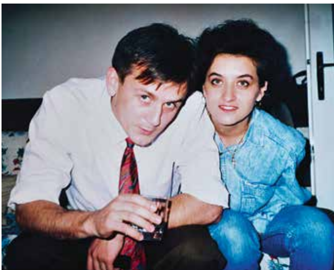
"Nakon godina podstanarstva moja supruga i ja prvi smo stan kupili 2002. u Cvjetnom naselju, gdje smo bili i kao podstanari, a u Vrbaničevu ulicu smo se preselili 2011."